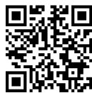
GUÍA DE INSTALACIÓN